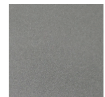
silver dark (opz.9507N) dark silver