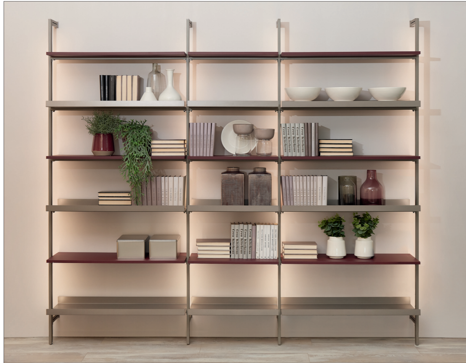
ESEMPIO DI VERSIONE LIBRERIA A PARETE CON KIT LUCE LED DUAL COLOR EXAMPLE OF THE WALL BOOKCASE VERSION WITH DUAL COLOR LED LIGHT KIT

"MULTIPLO" is a multifunctional system with aluminium structure, that allow to create opened structure solutions. The versatility and the simplicity of this project lay in the essential look and its easy to assemble nature, making it perfect for every space.