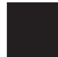
nero (opz.7892) black